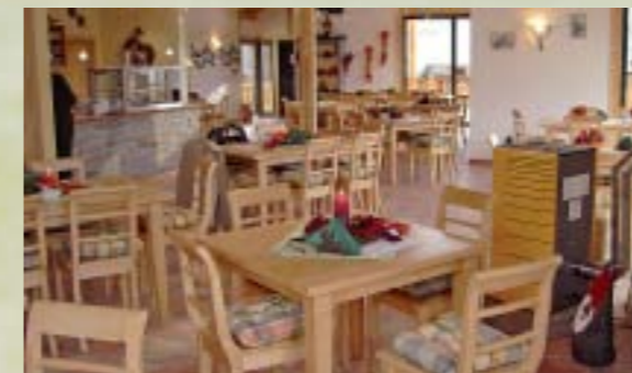
Im Hofcafé auf Hof Hagdorn gibt es selbstgebackene Torten und ofenfrisches Brot – und ein großes Frühstücksbuffet