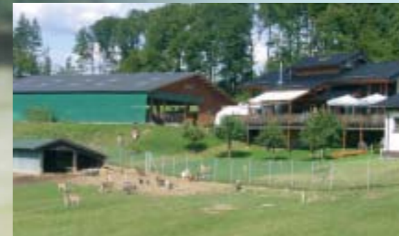
Die offenen Ställe (links) liegen in unmittelbarer Nähe des Bauernhofcafés (rechts). Hier gibt es selbst gebackenen Kuchen