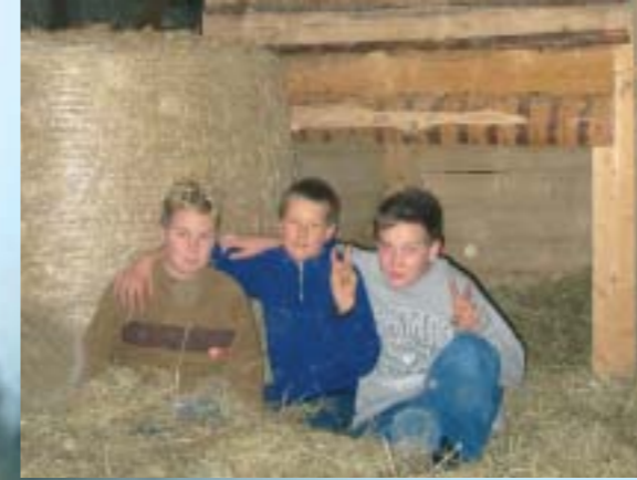
Bei Regen toben die Kinder in der Spielscheune. Schaukel, Kletterwand und jede Menge Heu machen daraus ein Kinderparadies